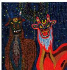
昨年 の 作 品